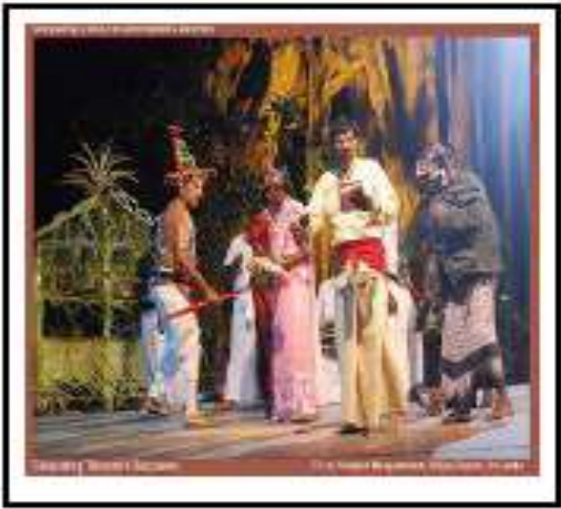
(10 ශ්‍රේණිය නර්තනය අතිරේක කියවීමේ පොත ඇසුරිණි.)

සොකරිය උඩරට සාම්ප්‍රදායික කාන්තාවකගේ ස්වරූපයට සමාන වන සේ ඔසොරියකින් හැඩගන්වා ඇති අතර, අතට සහ පයට සිහින් ගෙජ්ජි ද, කරට ඇට මාල ද, කනට කරාබු ද, අතට විදුරු වළලු ද පලඳා ඇත. සොකරි නාටකයේ ගැහැනු වර්ත පිරිමින් රඟපාන බැවින් බොරු කොණ්ඩයක් පලඳි. කොණ්ඩය මල් වැලකින් සරසයි. නළලේ පටියක් ද පලඳින අතර, අතෙහි මල් පොකුරක් ද ඇත. ඇතැම් ප්‍රදේශවල මල් පොකුර වෙනුවට ලේන්සුවක් භාවිත කරයි.