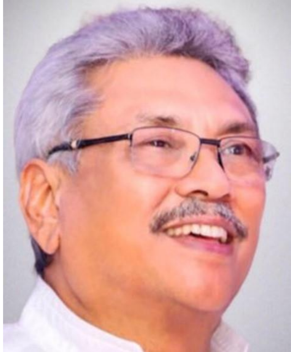
2020 සිට ගෝඨාභය රාජපක්ෂ