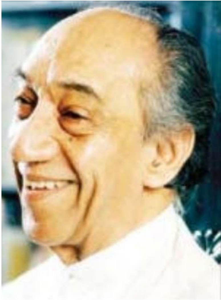
1977 - 1989 ජේ. ආර්. ජයවර්ධන