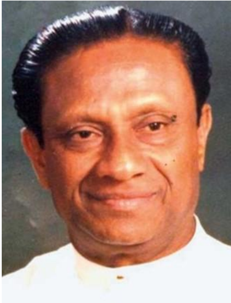
1989 - 1993 රනසිංහ ප්‍රේමදාස