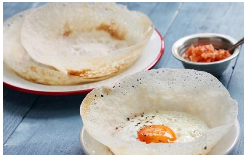
කිරි කබළු - ආජප