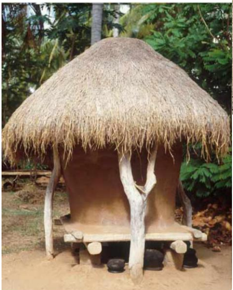
හතර අවස්ථාවේ යැවීමට තවම දුම කැබලිවැඩි වී තිබේ