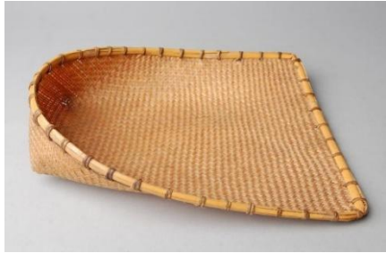
යතුර - කුල්ල