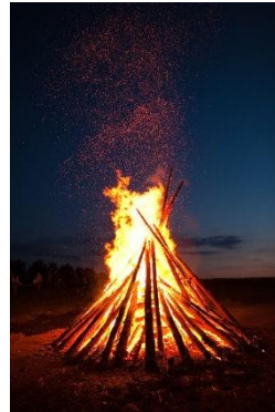
රත්තා බෝ කිරීම - ගිනි මැල ගැසීම