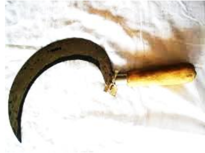
ලියන්තාව - දැකැත්ත