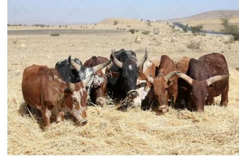
අම්බරුවන් - හරක්