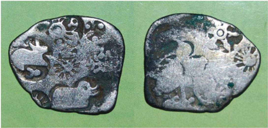
ජායාරූපය අංක 6.2 ශ්‍රී ලංකාවේ භාවිත වූ පැරණිම කාසියක්. මෙම කාසි වර්ගය හඳුන්වන්නේ හස්ඵම කාසි යනුවෙනි. එහි නිපදවන ලද්දේ ඉන්දියාවේ දීය. වෙළෙඳුන් විසින් එම කාසි මේරටට ගෙන එන ලදී.