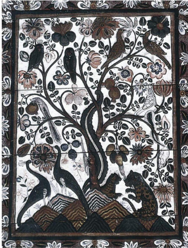
රජයාගේ අංක 6.6 වර්ෂයේ පිළිබඳව අපේ මුතුන්මිත්තන් කුම මිත්තන් අවධානයක් තිබේ. හැකි තැන අවස්ථාවක මී වර්ෂයේ යුධ කැනීමට මිලිනු කටයුතු කළහ. වර්ෂයේ කිසිවක පිටිමන බව පෙන්වන මෙම චිත්‍රය දකුණු ඉන්දියානු සිතුවම් විද්‍යාවේ අදහස් ලද්දකි.