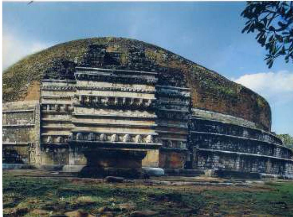
මිහින්තලයේ කණ්ඞක චේතියේ වාහල්කඩ