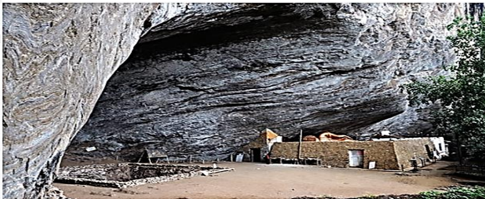
ජයාග්‍රාමය අංක 2.1 කළුතර දිස්ත්‍රික්කයට අයත් මුලක්කිංහල පාහියන්ගල පිහිටි මෙම ගල් ගුහාව වීම් අවුරුදු 38 000 ඉහත කාලයක දී ප්‍රාග් ඓතිහාසික මානවයන්ගේ වාසස්ථානයක් වී ඇති බවේ සාහිත්‍යමය ලෙස ශ්‍රී ලංකාවේ පහතරට තෙත් කලාපයේ පිටත් වූ ප්‍රාග් ඓතිහාසික මිනිසුන්ගේ ජීවිතය පිළිබඳ වැදගත් තොරතුරු අනාවරණය කර තිබේ.