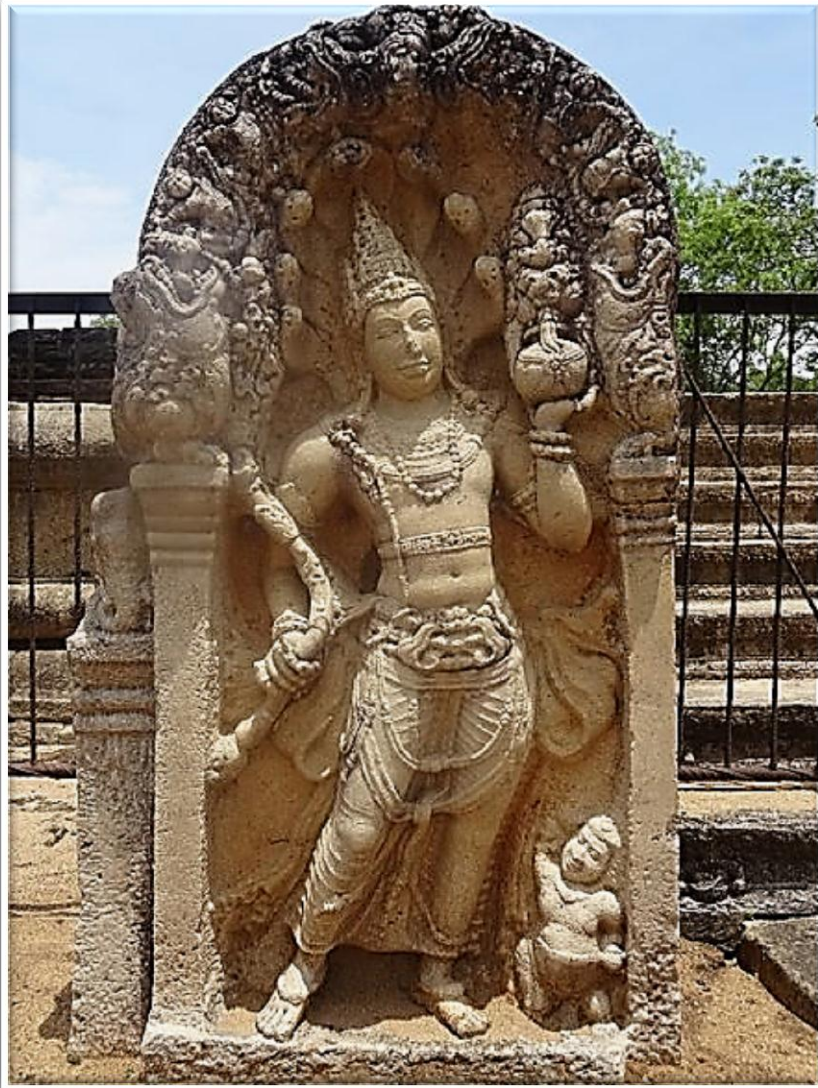
අභයගිරියට අයත් රත්න ප්‍රාසාදය අසල ඇති මුරගල