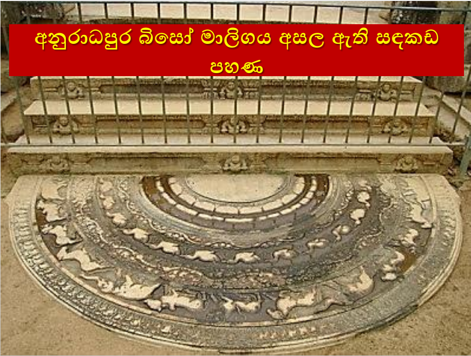
අනුරාධපුර බිසෝ මාලිගය අසල ඇති සඳකඩ පහණ