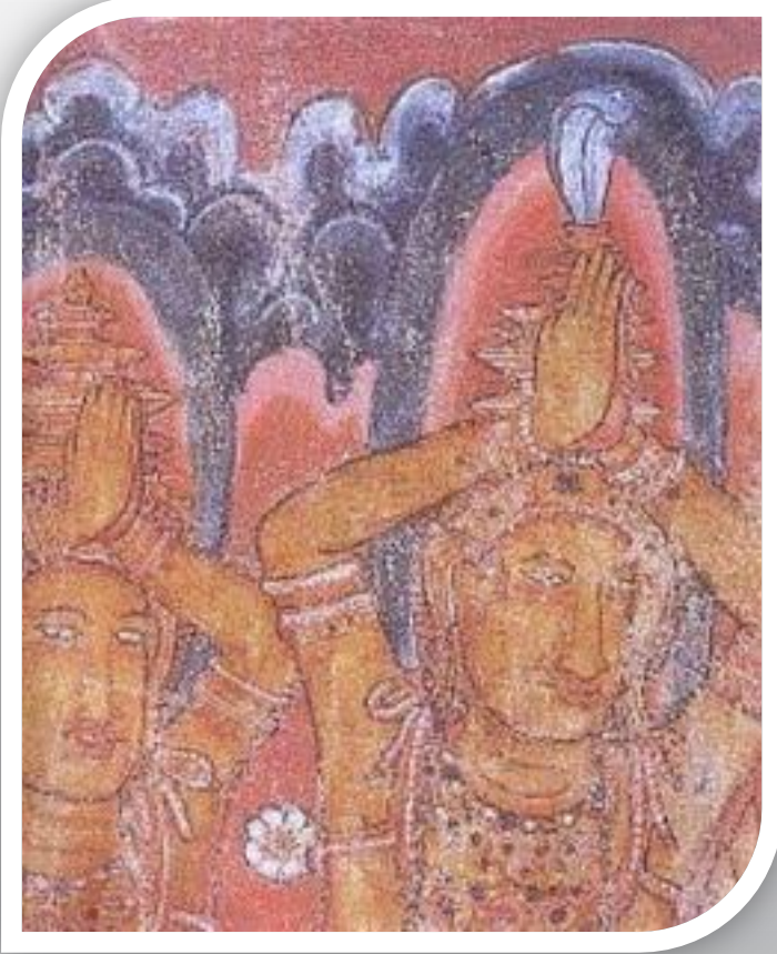
මහියංගනය ස්තූපයේ ධාතු ගර්භයේ සිතුවම්