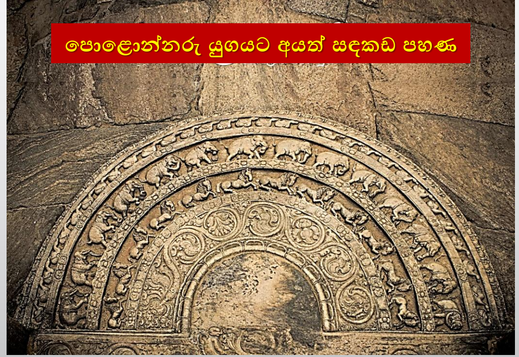
පොළොන්නරු යුගයට අයත් සඳකඩ පහණ