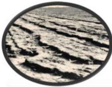
පස සෝදා යාම (පාංශු බාධනය)