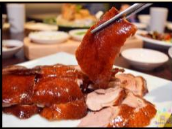
běijīng kǎoyā 北京烤鸭