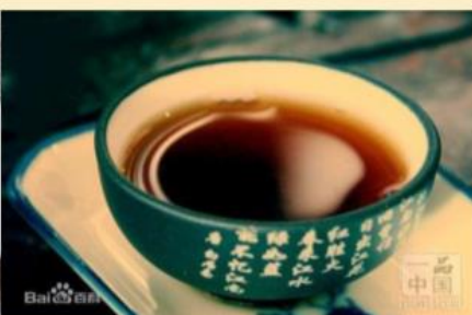
hēi chá 黑茶