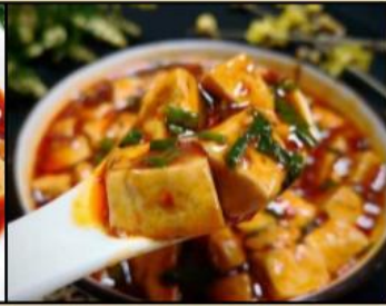
má pó dòufu 麻婆豆腐