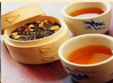
huáng chá 黄茶