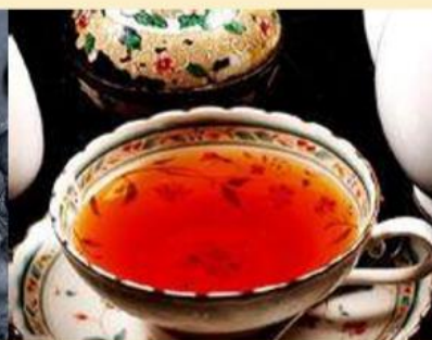
qīng chá 青茶