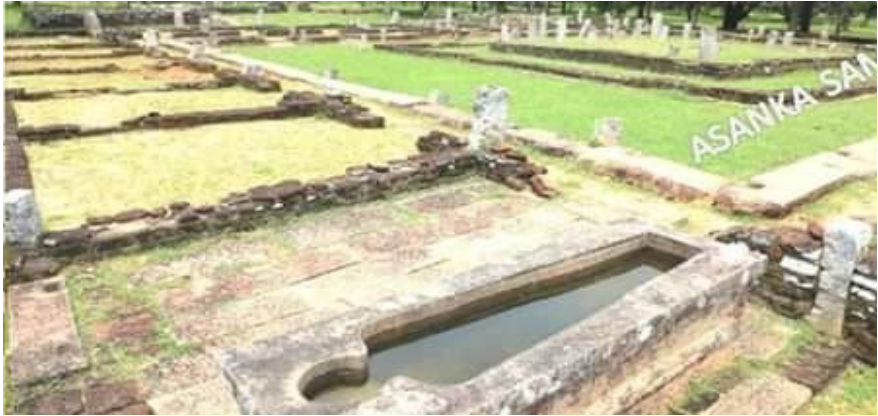
මිහින්තලේ පැරණි රෝහල