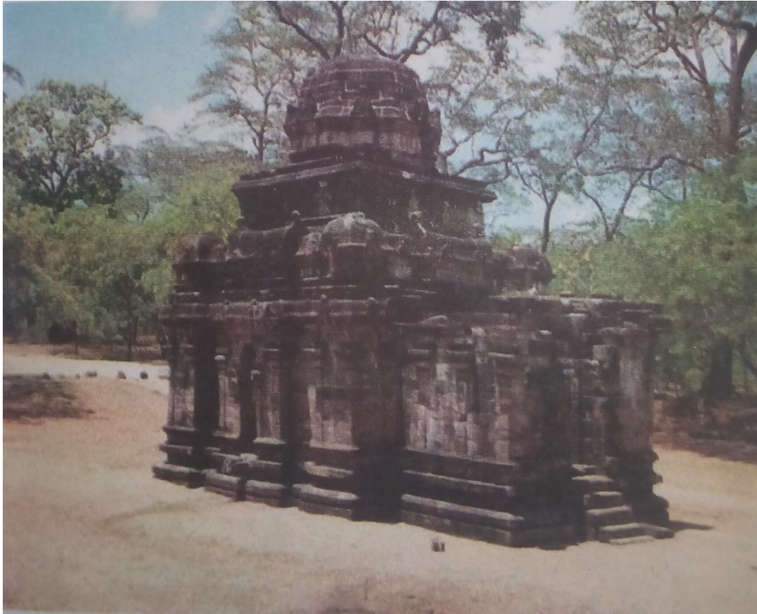
පොළොන්නරුව ශිව දේවාලය