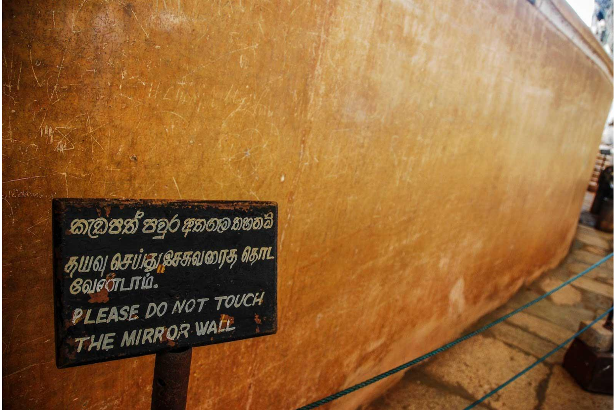
සිගිරි කුරුටු ගී සහිත කැටපත් පවුර