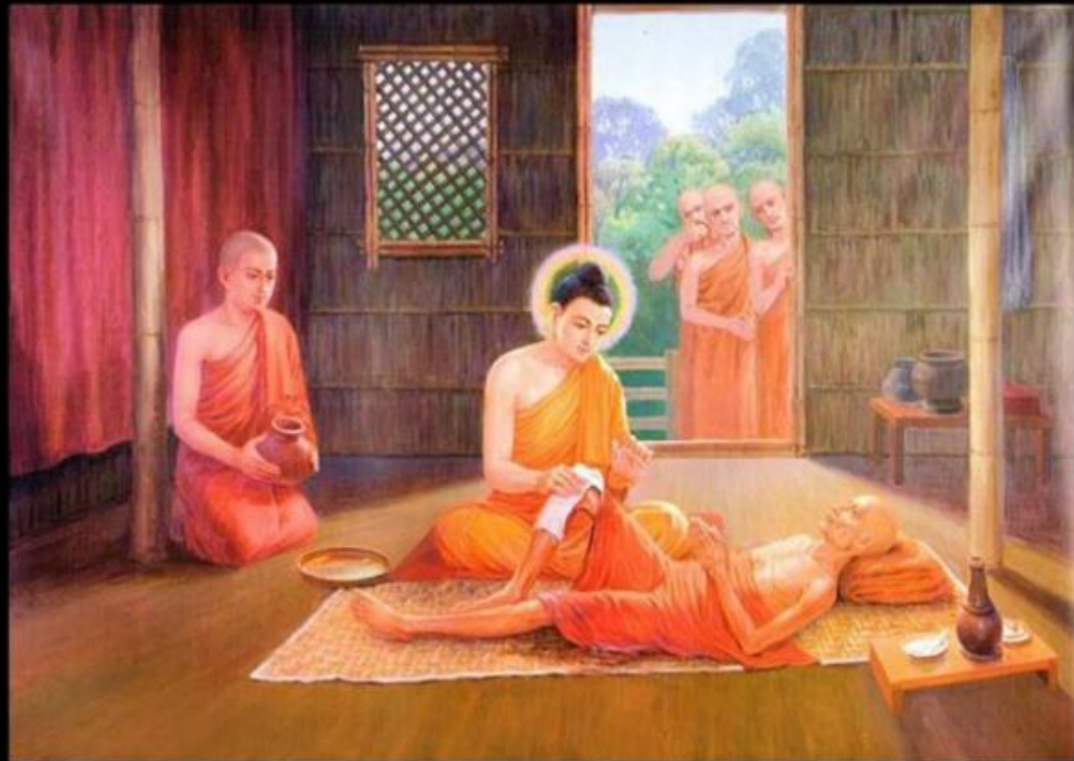
පුත්තිගන්ත නිස්ස හිමියන්ට මුදුරුදුන් උපස්ථාන කරන ආකාරය දැක්වෙන සිතුවමක්