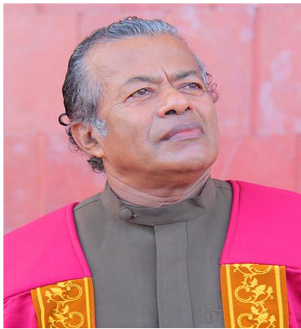
මහාචාර්ය ලයනල් බෙන්තරගේ