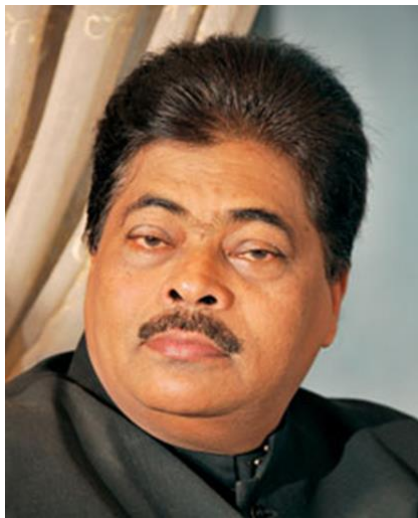
මහාචාර්ය ජයසේන කෝට්ටගොඩ

මීට අමතරව මෙතුමා ප්‍රයෝගික පහතරට නර්තනය 1-2 යන පොත් දෙකද මැණික් පාල ශාන්තිය, සුනියම් කැපිල්ල ආදී කෘති ගණනාවක් රචනා කර ඇත.