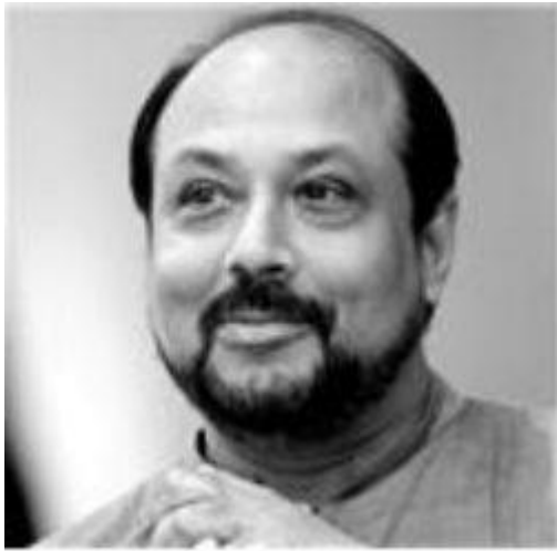
මහාචාර්ය මුදියන්සේ දිසානායක මහතා

මීට අමතරව වලියක් මංගලය ,කන්‍යා යාගය ,කඩවර කංකාරිය ,මුට්ටි නැමිල්ල ආදී කෘති ගණනාවක් රචනාකර ඇත .