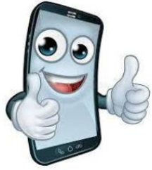
けいたいでんわ 携帯電話