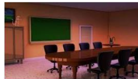
かいぎしつ 会議室