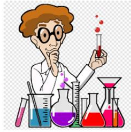
じっけんしつ 実験室