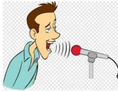
こえ だ 声を出す