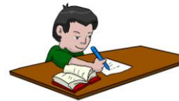
しゅくだい うつ 宿題を写す