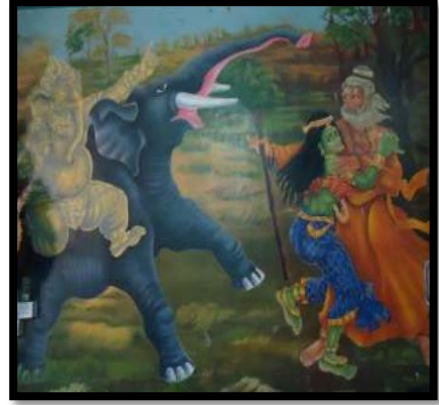
ඇතා වල්ලිව එලාව ගෙන යාම සිතුවම