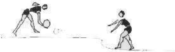
இருவருக்கிடையில் பந்தை நிலத்தில் உருட்டி அனுப்புதல்