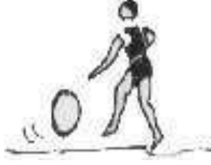
பந்தை நிலத்தில் சொட்டியவாரு முன் நோக்கி நடத்தல்