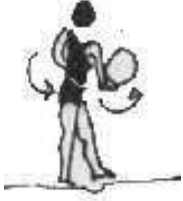
பந்தை கைக்கு கை மாற்றுதல்