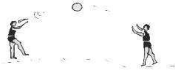
இருவருக்கிடையில் பந்தை எறிந்து பிடித்தல்