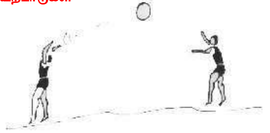
முன்னால் உள்ள வீரர் பந்தை தலைக்கு மேலால் பின்னோக்கி எறிதல்