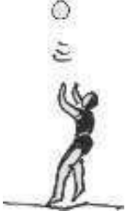
பந்தை மேலே போட்டுப் பிடித்தல்