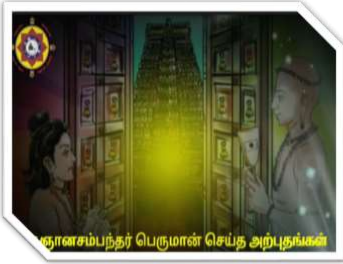
ஞானசம்பந்தர் பெருமான் செய்த அற்புதங்கள்