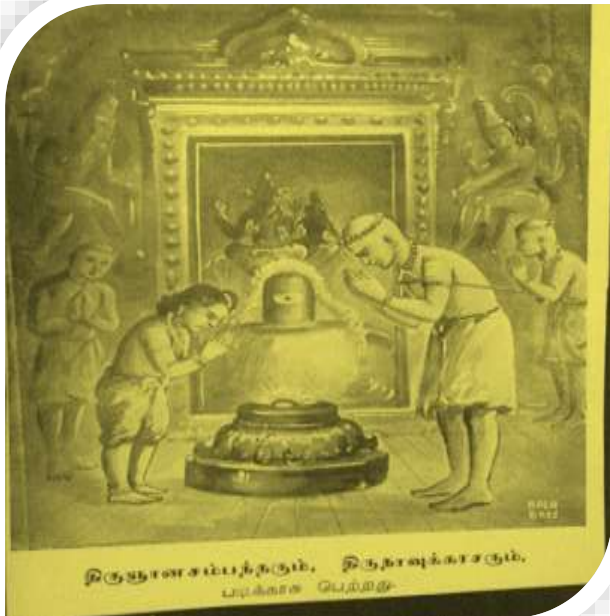
திருஞானசம்பந்தரும், திருநாவுக்கரசரும், பாடிய பெருமதம்

சந்தர்ப்பம் - மாரிவளம் குன்றி பஞ்சம் ஏற்பட்டு பசிப் பிணியால் வருந்திய அடியார்களுக்கு படிக்காசு பெற்று அமுது செய்வித்தல்.