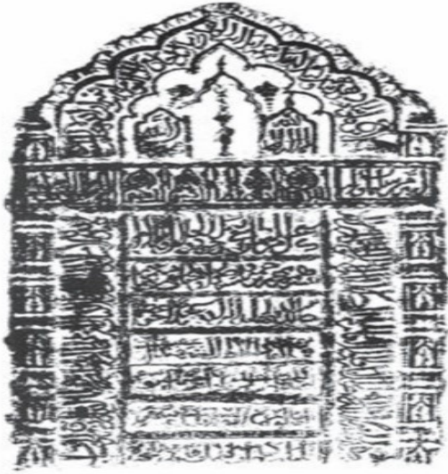
உரு 4.8. அராபியர்களுக்கு உரித்தான புதைக்குழி கல் ஒன்றில் செதுக்கப்பட்டுள்ள கல்வெட்டு. இதில் காணப்படுவது கியூபிக் அரபு எழுத்துக்களாகும்.