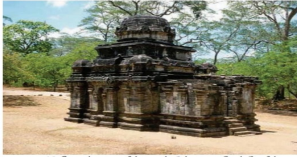
பட 1.6. பொலன்னாவையில் காணப்படும் பாகள சிவன் கோவில்