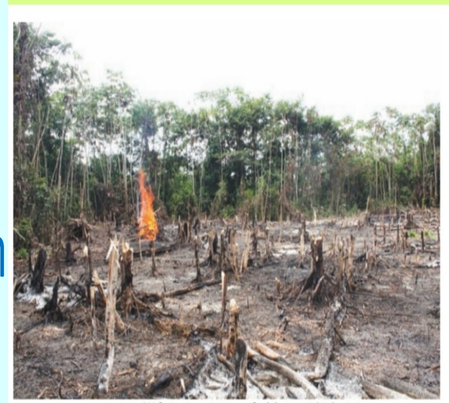
உரு 4.2. பல்லிச் செங்குத்து முல்லைத் தவறிய சேனை ஒன்றின் தெற்றம்