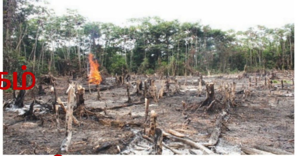
4.2.1-இல் செங்கைக்கு முன்னைய நிலத்தினை சேனை ஒன்றின் தோற்றம்